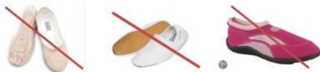
Ballet schoenen Turn schoenen Surf schoen

Wordt jouw type schoen niet vermeld dan zal de examen official zich de vraag stellen: "Kan ik de zool tussen twee wijsvingers zonder moeite samengevouwen?" Wordt deze vraag met ja beantwoord dan zijn de zolen niet stevig en zal de schoen worden afgekeurd!