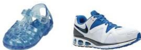
Plastic Sandaal/waterschoen Sportschoen